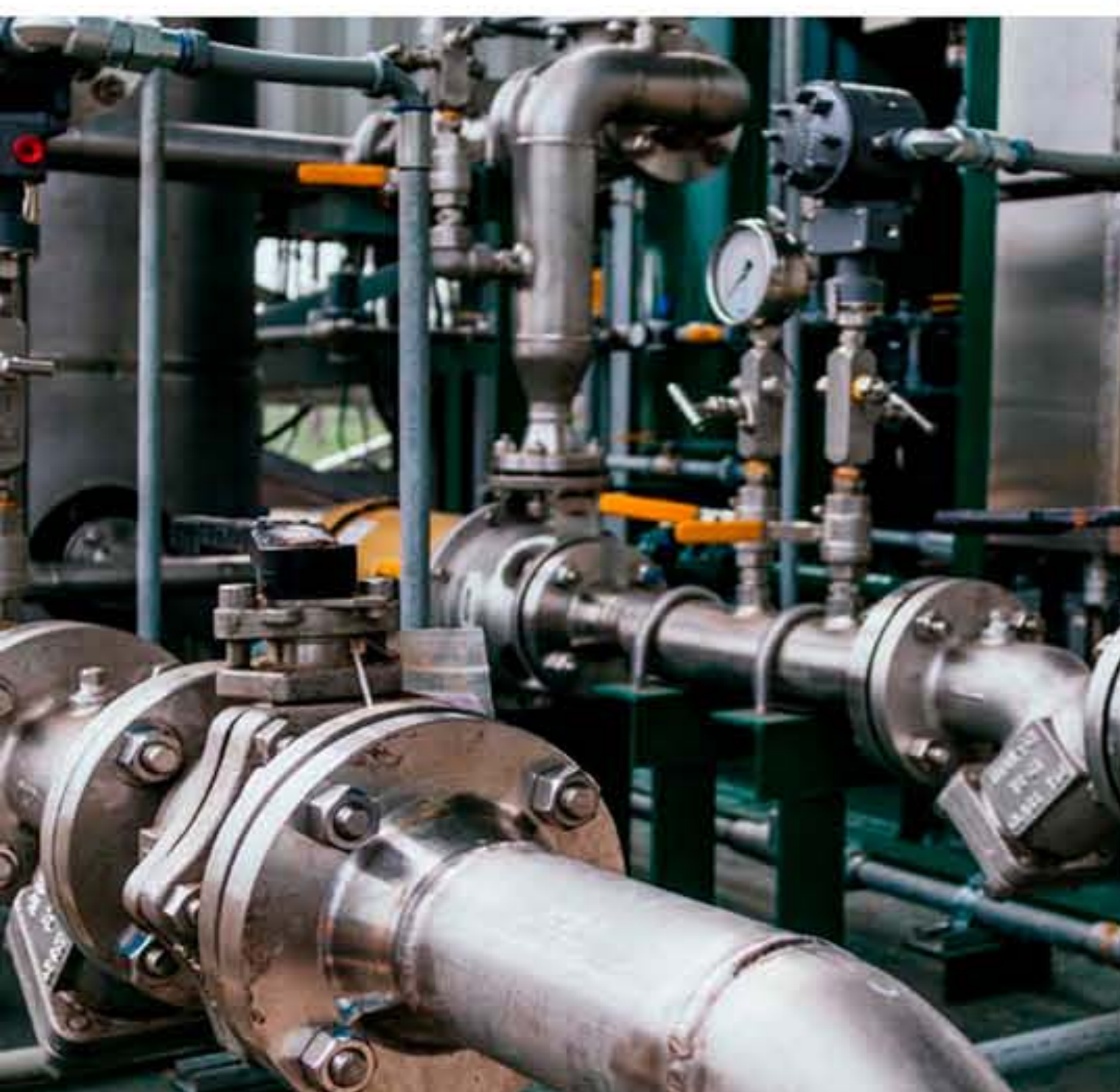
PIPING DE ALTA CALIDAD