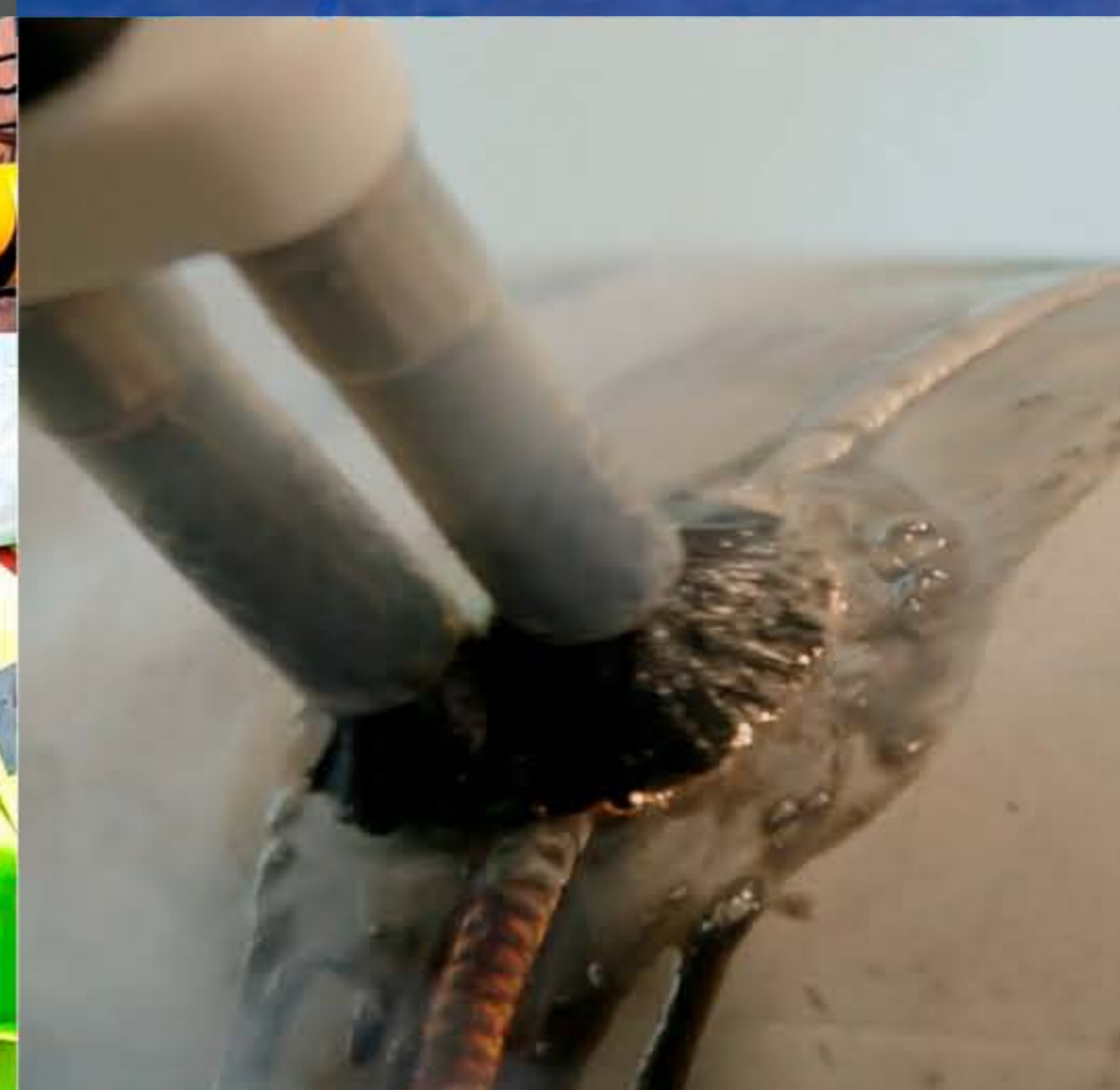
LIMPIEZA ELECTROQUÍMICA DE ACERO INOXIDABLE