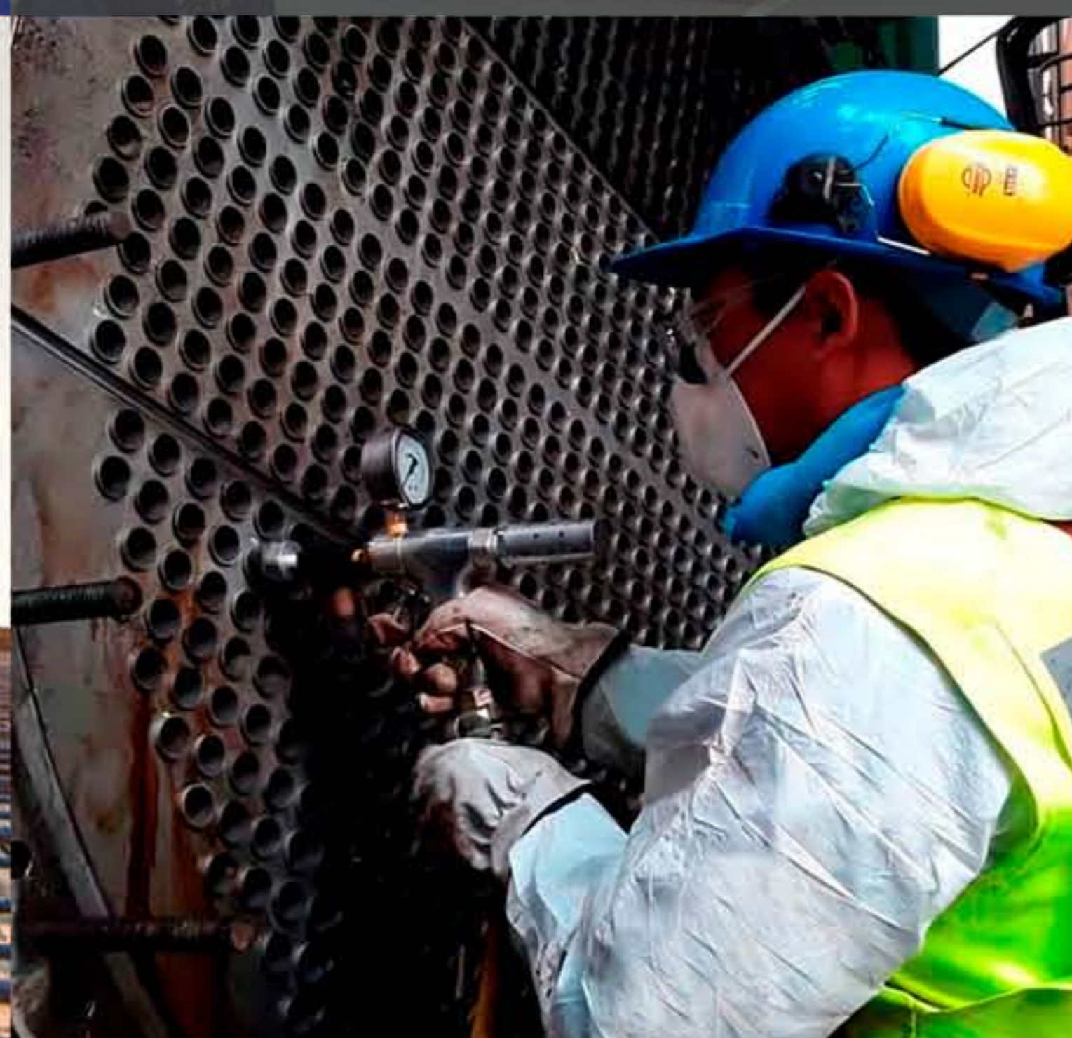
PRUEBAS DE VACÍO Y CAMBIO DE TUBOS